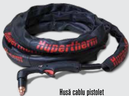
Husă cablu pistol