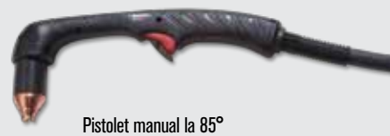
Pistol manual la 85°

(pentru mai multe tipuri de pistoale consultați www.hypertherm.com )