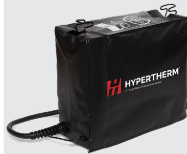
Husă antipraf pentru sistem