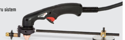
Compas pentru tăieri circulare

Aflați mai multe accesând www.hypertherm.com/powermax33XP