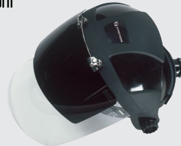
Mască de protecție